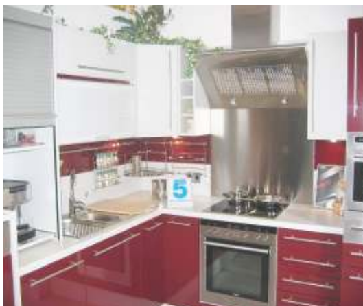
Musterküche aus der Auslage

Smolibowski hat fast keinen Werbeaufwand und auch aus diesem Grund kann er bei den Markenküchen eine Preisgestaltung erbringen die sich sehen lassen kann.