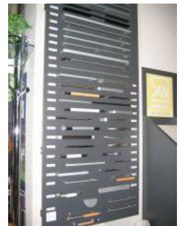
Auswahl an Griffen

Egal ob für „Dan“ - „Ewe“ – „Braal“ - „Haka“ oder eine andere Marke. Jeder Extra-Wunsch wird am Computer ersichtlich gemacht und Sie haben Ihre fertige Küche vor Augen. Da Smolibowski jedoch ein kleines Küchengeschäft ist, so kann nicht alles in der Auslage sein, aber über Kataloge und PC ist alles für Ihre Wunschküche erhältlich.